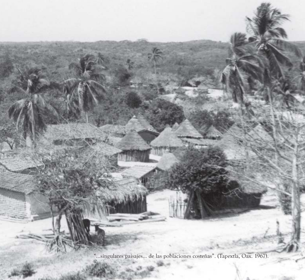
“...singulares paisajes... de las poblaciones costeñas”. (Tapextla, Oax. 1967).