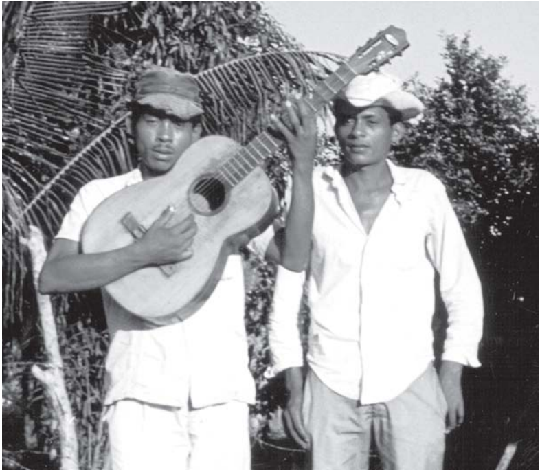
“...estimados en sus comunidades...por su competencia artística...” (Río Grande, Oax. 1967).