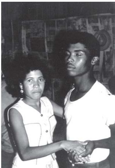
“...les gusta bailar... vales corridos”. (Río Grande, Oax. 1967).