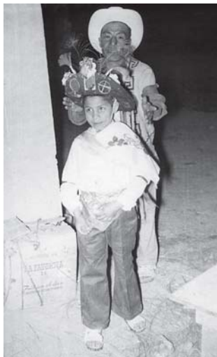
Negrito (Barrio de San José, Tetela de Ocampo)

Entre los grupos indígenas, el son es la pieza o unidad melódica que estructura las danzas. Estos géneros coreográficos se interpretan en ocasión de las grandes fiestas religiosas. Se incluye música de tres de las danzas más representativas del estado de Puebla: Voladores , Negritos y Tecuanes , las cuales están formadas por un número variable de sones, generalmente entre diez y quince.