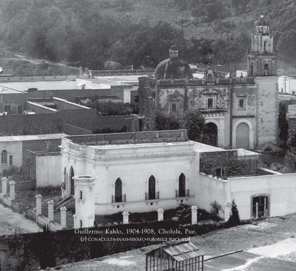
Cholula, Pue.