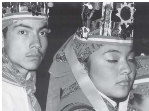
Parejas de mestizos que se integran a las danzas tradicionales.

(como allá les dicen) en las fiestas y ceremonias más importantes de la Huasteca, las de Todos Santos o Xantolo . Tampoco incluimos el repertorio propio de las bodas, ni muchos de los bellos sones que bailan jóvenes varones, ni los que cantan y bailan niñas y jovencitas nahuas en las fiestas patronales. Y si bien tuvimos que dejar fuera muchas y bellas piezas musicales, aquí damos a conocer exquisitas tradiciones musicales, como la que es propia de La danza de Moctezuma , interpretada exclusivamente como un dueto formado por arpa y jarana. Asimismo privilegiamos hermosos huapangos desconocidos fuera de su región, como es el caso de los que tienen nombre de aves.