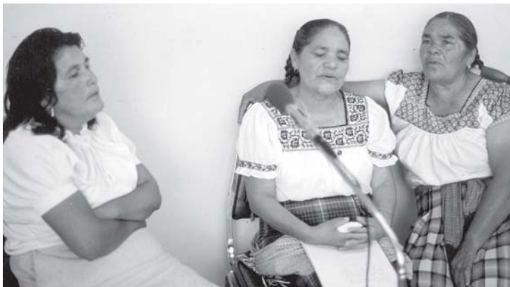
Los cantos a capella , sonoridad de la tradición oral