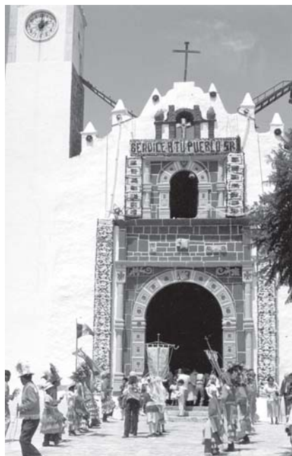
Edificios históricos-religiosos, mudos escenarios de la tradición dancística.

El grupo étnico más importante en la entidad es el hñahñú (otomí) que, procedente de Xilotepec (Estado de México), en la prehistoria llegó al Valle del Mezquital cuando tenía vida nómada; existen testimonios de esa etapa