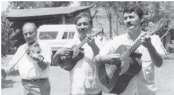
Trío huapanguero, conjunto característico de la región huasteca.

El pixcuhuil es un pajarito negro que se come las garrapatas del ganado.