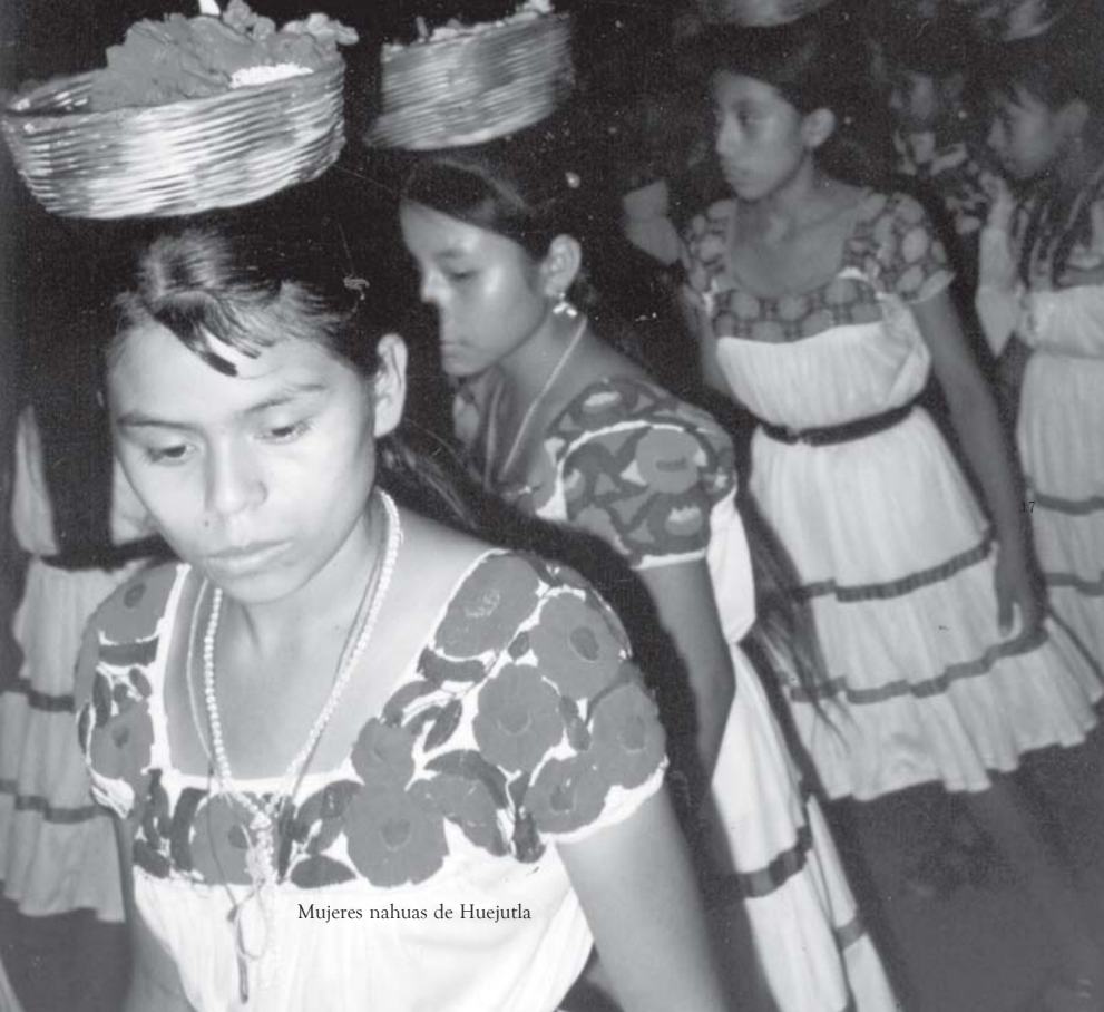
Mujeres nahuas de Huejutla