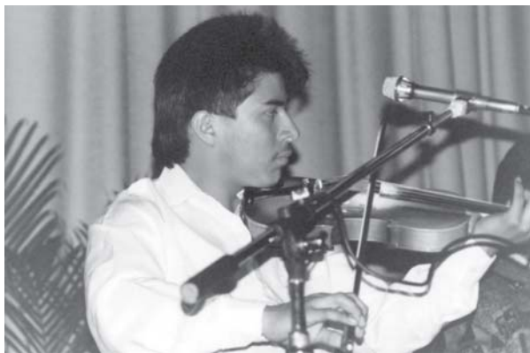
El violín, de gran arraigo en la región huasteca del estado.

Se puede decir que La danza de tres colores es la contraparte o complemento de La danza de inditas , sólo que en este caso, quienes bailan son niños y jóvenes. El propósito de ambas manifestaciones religiosas es el mismo: rendir veneración a la imagen patronal y a otras de especial significación para los nahuas de la Huasteca.