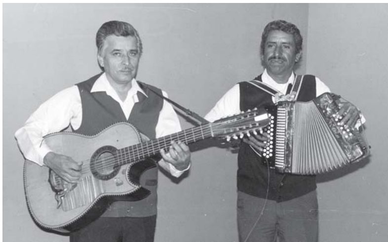
La música norteña se distingue con el conjunto de acordeón y bajo sexto.

Mier, Montañeses del Alamo , integrado de violín, flauta, saxofón, guitarra y contrabajo.