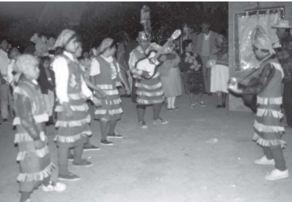
En las danzas se aprovechan sonecitos y jarabes, algunos de origen colonial.