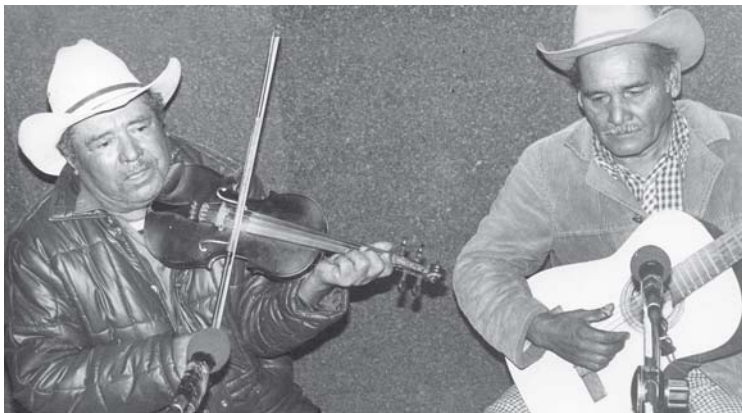
La música nortea es ahora un estilo de composición.

dos en estrofas de cuatro a ocho líneas. El estribillo es poco usado. Por su contenido adquiere usos particulares; así hablamos de canción de cantina (abundando los boleros con temas de abandono), canción de serenata (para cantarse al iniciar la madrugada como saludo, felicitación o declaración amorosa), y canción de boda (con saludos y consejos para los recién casados). En general, casi todas las canciones tocan temas de amor, aunque de tanto en tanto aparecen ejemplos que desarrollan temas filosóficos, de cariño al terruño, recuerdos históricos y relatos humorísticos.